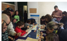
UNA FEINA D'ARTISTES I UN CÀLID MATÍ